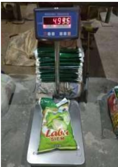
Gambar 6. Beras 5