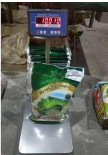
Gambar 7. Beras 10