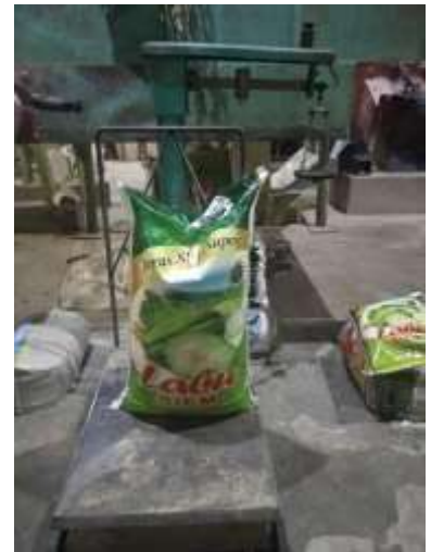
Gambar 3. Beras 20