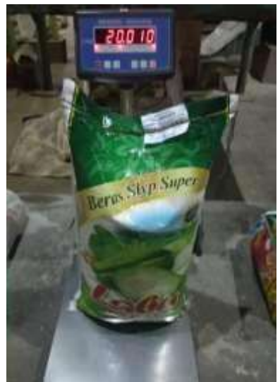
Gambar 8. Beras 20