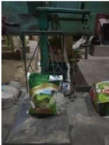
Gambar 1. Beras 5