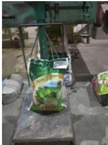
Gambar 2. Beras 10