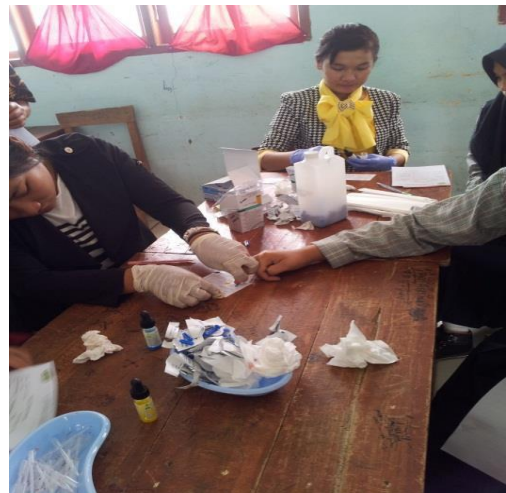
Gbr 3.2 Pelaksanaan Pemeriksaan