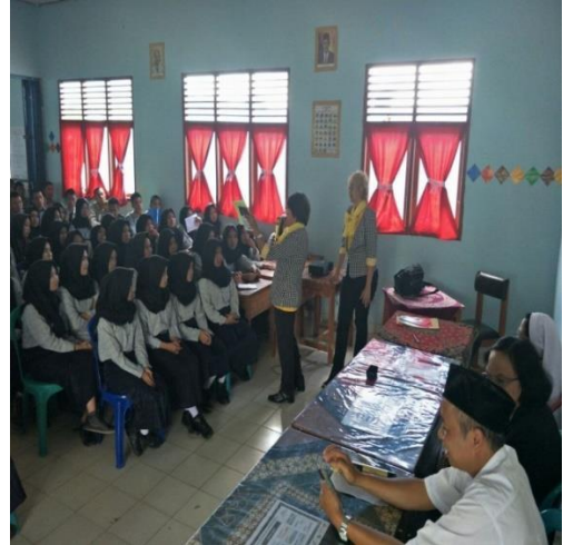
Gbr 3.1 Pelaksanaan Penyuluhan