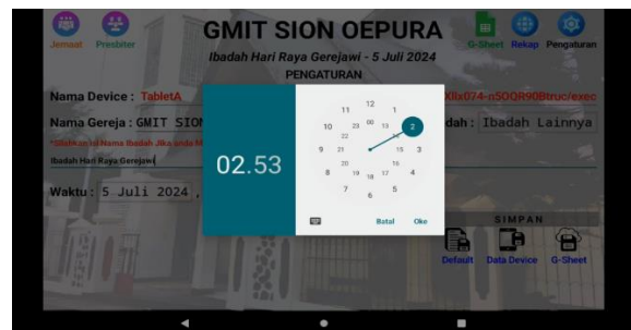
Gambar 4. Kegiatan PKM 3