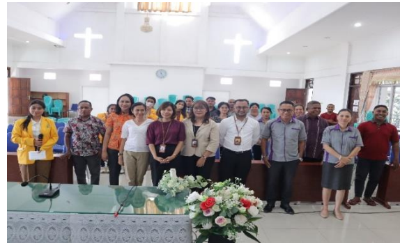
Gambar 2. Kegiatan PKM 1