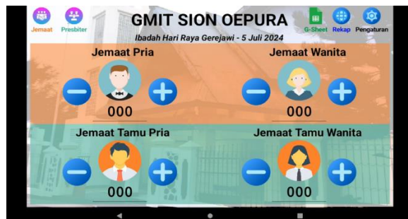
Gambar 5. Kegiatan PKM 4