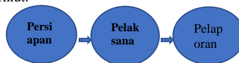
Gambar 2. Tahapan Pelaksanaan PKM

seperti yang digambarkan pada Gambar 2. berikut: