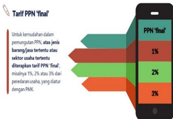
Gambar 5 Materi yang pelaksanaan kegiatan PKM

Keempat, memberikan pelatihan kepada seluruh staf bagian perpajakan perusahaan tentang pembuatan faktur pajak sesuai dengan PER 03/PJ/2022. Proses pelaksanaan kegiatan dikemas dalam suasana santai untuk memudahkan peserta dalam memahami materi. Penjelasan mengenai esensi penerapan UU No. 7 Tahun 2021 bertujuan untuk memudahkan peserta memahami arti penting serta tujuannya, sehingga mereka dapat dengan mudah menerapkannya serta mempertimbangkan dampaknya bagi keseluruhan operasional bisnis perusahaan.