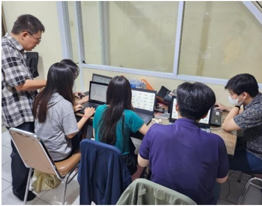
Gambar 6 dan 7 Foto kegiatan pelaksanaan kegiatan PKM

Sepanjang kegiatan, peserta sangat aktif dalam mempelajari materi. Kondisi ini ditandai dengan beberapa pertanyaan dan tanggapan dari peserta mengenai pembelajaran PKM. Kegiatan ini berjalan lancar, dan dari ekspresi peserta yang terlibat, nampak bahwa mereka memahami keseluruhan pelatihan karena materi yang disampaikan sangat terkait dengan pekerjaan operasional mereka.