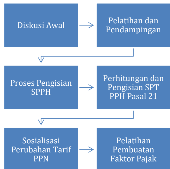
Gambar 1 Bagan Pelaksanaan kegiatan PKM

Adapun kegiatan dapat dilihat pada bagan berikut :